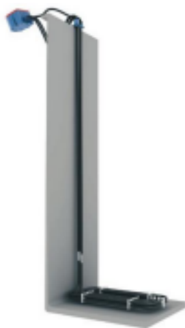
Option fond de cuve