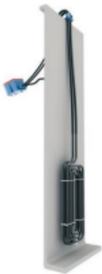
Option bord de cuve