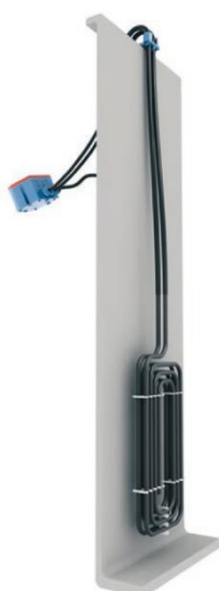
Option bord de cuve