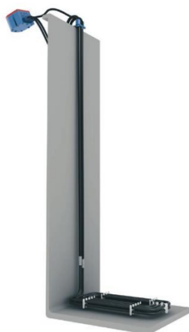
Option fond de cuve